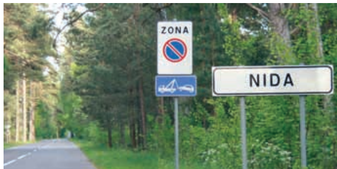
Куршская коса. Приграничный с Россией поселок Нида

А сейчас нам предстояло пересечение границы с Россией. Подъехав к посту, с удовольствием обнаружили, что машин нет и мы чуть ли не единственные клиенты пограничников. Расслабленный персонал таможни был дружелюбен и шутил