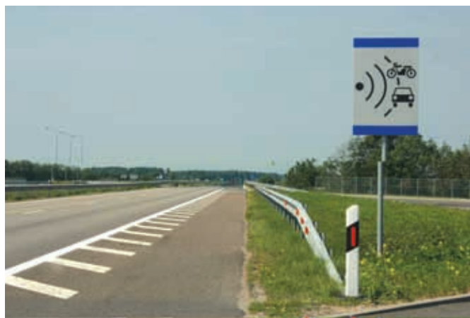
Контроль скоростного режима. Предупреждающий знак

Поскольку мы планировали засветло попасть в Калининград, то заезжать в Каунас не стали, предпочтя ему прогулку по Клайпедой. Но и она у нас получилась сильно сокращенной, поскольку по прибытии выяснилось, что моста через пролив на Куршскую косу нет. Пришлось потратить много времени на поиск паромной переправы.