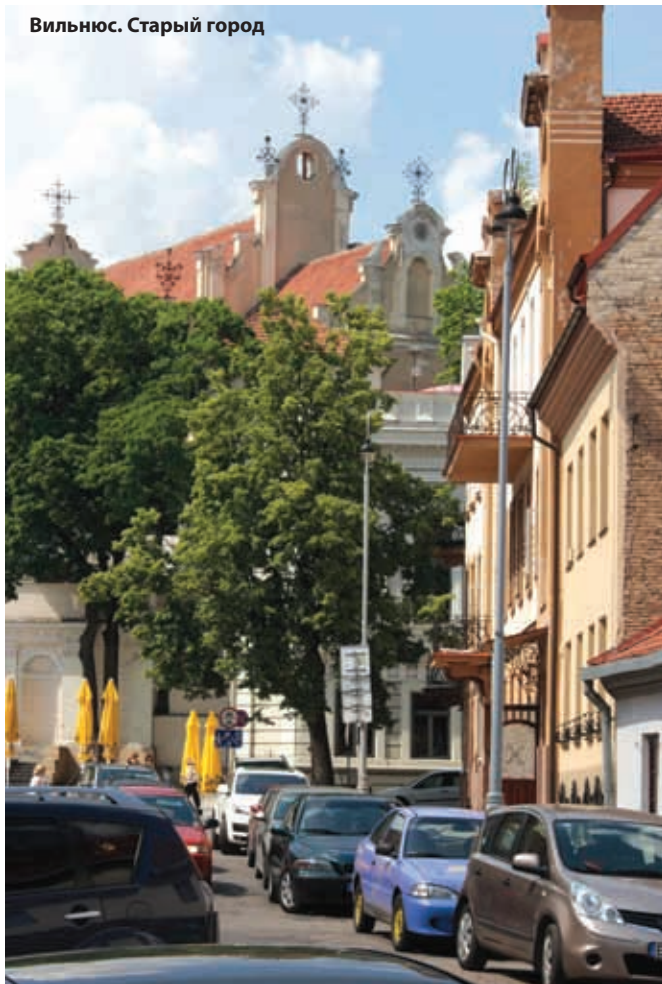
Вильнюс. Старый город

Вильнюс – один из старейших городов Литвы, но точных данных о дате его основания нет, известно лишь, что в XIV веке великий князь Гедиминас, именем которого назван один из центральных проспектов, приехал сюда на охоту и заночевал. Во сне он увидел огромного железного волка на горе, а жрецы растолковали ему это как необходимость заложения замка, который станет столицей всех литовских земель. Вой волка означал славу, которая распространится по всему миру. Так образовался город Вильнюс. Сегодня, так же, как и в былые времена, город, действительно, является одним из культурных центров Восточной Европы. Благодаря своему выгодному географическому положению он выполняет функцию ворот в страны Балтии. Как и полагается средневековым городам Европы, Вильнюс имеет старую и новую часть.