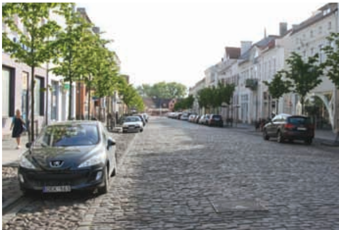
Улица в Клайпеде

недолго, приготовившись к длительной поездке по волнам залива, мы, на удивление, уже через 5 минут были на другой его стороне.