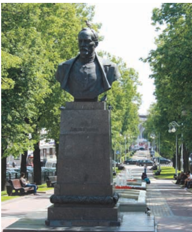
Вид на одну из центральных улиц Минска

достижение союзного государства. Усиливает положительный эффект понимание того, что ты находишься на постсоветском пространстве. Расстояние по одометру от Москвы до Минска составило 720 километров, время в пути – 8 часов с остановками. Рекомендуем заправить полный бак на подъезде к границе или сразу после нее, так как потом заправки нам не встречались. Бензин в Белоруссии стоит дешевле российского, примерно на 3 рубля. Кстати, нам довелось побывать там в разгар так называемого кризиса, но его признаков нами замечено не было.