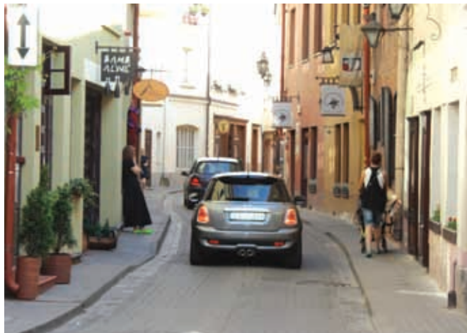
Узкие улочки Вильнюса