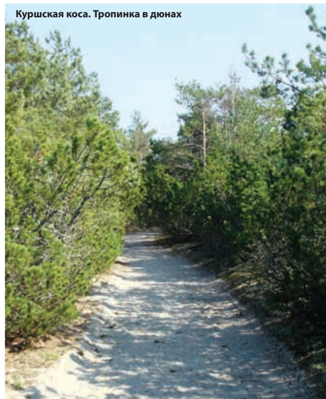
Куршская коса. Тропинка в дюнах