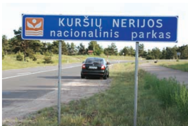
Национальный парк «Куршская коса»