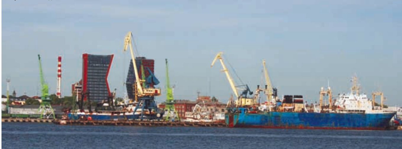
Порт в Клайпедой

Забегая вперед, скажем, что мы сюда еще вернемся в рамках нашего автопутешествия, а пока отправляемся на паром, ведь нас ждет Калининград. Три парома курсируют между Куршской косой и Клайпедой каждые 20 минут и вмещают, в среднем, 20 легковых автомобилей, а также автобусы и людей, перемещающихся пешком и на велосипедах. Переправа платная. Плыть, как выяснилось,