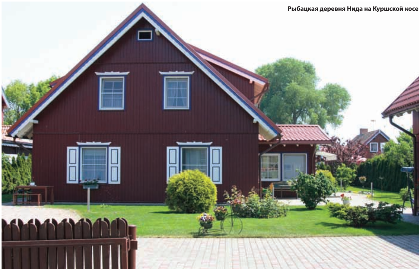
Рыбацкая деревня Нида на Куршской косе