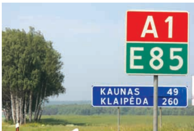
Дорога из Вильнюса в Клайпеду