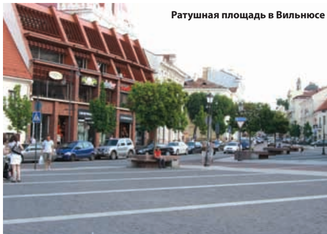
Ратушная площадь в Вильнюсе