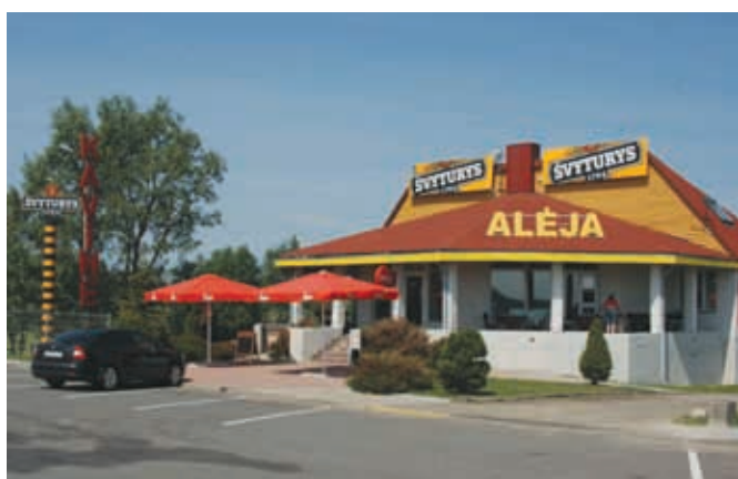
Придорожный сервис. Кафе на дороге в Клайпеду

Поскольку мы планировали засветло попасть в Калининград, то заезжать в Каунас не стали, предпочтя ему прогулку по Клайпедой. Но и она у нас получилась сильно сокращенной, поскольку по прибытии выяснилось, что моста через пролив на Куршскую косу нет. Пришлось потратить много времени на поиск паромной переправы.