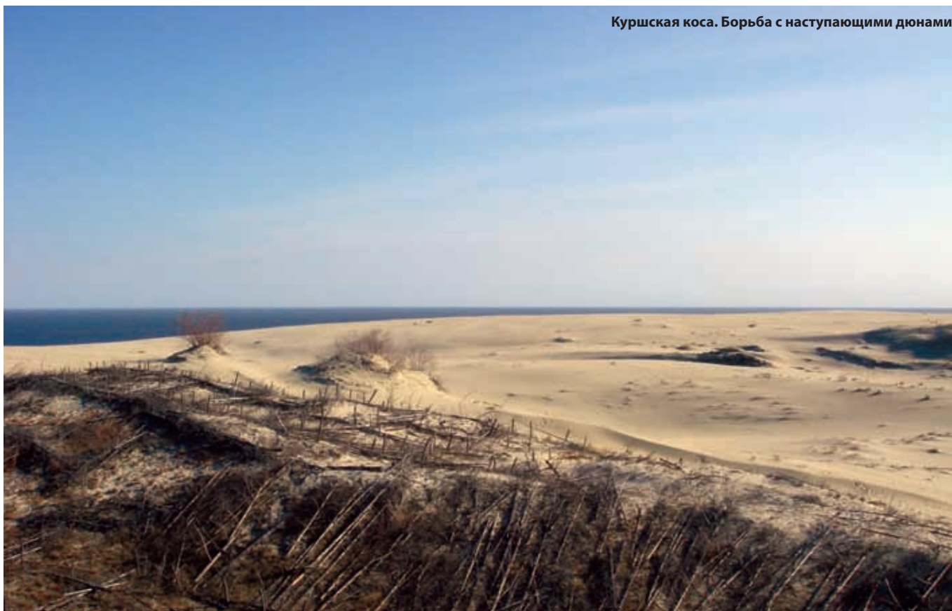
Куршская коса. Борьба с наступающими дюнами

ной Европе, достигающие 60 метров в высоту. Примерно 500 лет назад большая часть полуострова была покрыта лесами, но их массовая вырубка привела к нарушению экологического баланса, в результате чего пришли в движение зыбучие пески, поглотившие около полутора десятков рыбацких деревень. В начале XIX века это была уже пустыня, но наступление дюн удалось остановить благодаря работам по озеленению и высаживанию сосен. Сейчас большая часть полуострова покрыта сосновыми лесами, а вдоль балтийского берега простираются великолепные пляжи с белым песком. В 2000 году ЮНЕСКО внесло Куршскую косу в список всемирного наследия. Изюминкой литовской части Куршской косы является поселок Нида у самой границы с Россией. Это бывшая рыбацкая деревушка, которая сейчас превратилась в курорт. Особенностью Ниды является сохранение властями аутентичного образа деревни. В Ниде запрещено любое новое строительство, большая часть строений – это реконструированные рыбацкие домики большие и маленькие, многие используются как гостиницы. Население Ниды – 1500 человек, и при этом в поселке работает библиотека, банк, множество ресторанов и кафе, супермаркет. Но самое главное в Ниде – восхитительная прибалтийская природа, свежий сосновый воздух, чистое Балтийское море, отличный пляж с белым песком и приветливые местные жители. Если вы хотите тихого спокойного экологического отдыха со всеми удобствами, то лучшего места не найти.