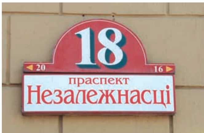
Центральная улица Минска – проспект Независимости