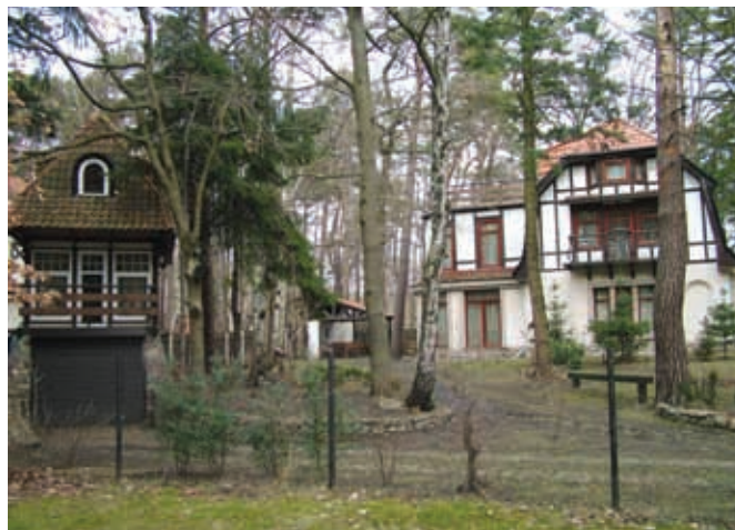
Старые немецкие здания в Светлогорске

На следующий день заехали в город Светлогорск – удивительно уютный небольшой курортный город на берегу Балтийского моря. Раньше он носил немецкое название Раушен и так же, как и сейчас, являлся курортным местечком. Город примечателен своей застройкой: сохранившиеся немецкие дома в стиле фахверк и неоготики отлично гармонируют с новыми архитектурными формами. Тихие улочки под тенью сосен располагают к неспешным романтическим прогулкам, а променады вдоль морского побережья кипит жизнью и не дает заскучать. Как и полагается городу-курорту, вдоль центральной улицы находятся кафе и рестораны, цены в которых очень высоки.