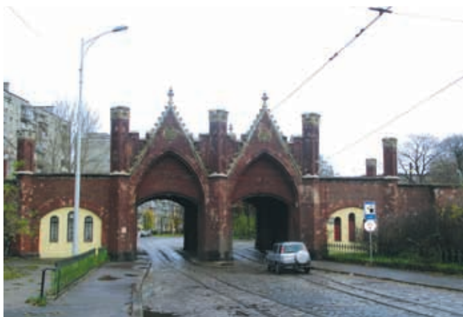
Довоенные дороги со старой брусчаткой

Но вернемся к другим достопримечательностям Калининграда, ради которых все-таки стоит увидеть этот замечательный город. Надо заметить, что и сегодня он сохранил немецкое лицо, хотя со временем этот облик был сильно разбавлен постройками советского периода. Черепичные крыши зданий, узкоколейные трамвайные пути довоенного периода, старая многовековая брусчатка – все это отголосок немецкого прошлого. Если вниматель-