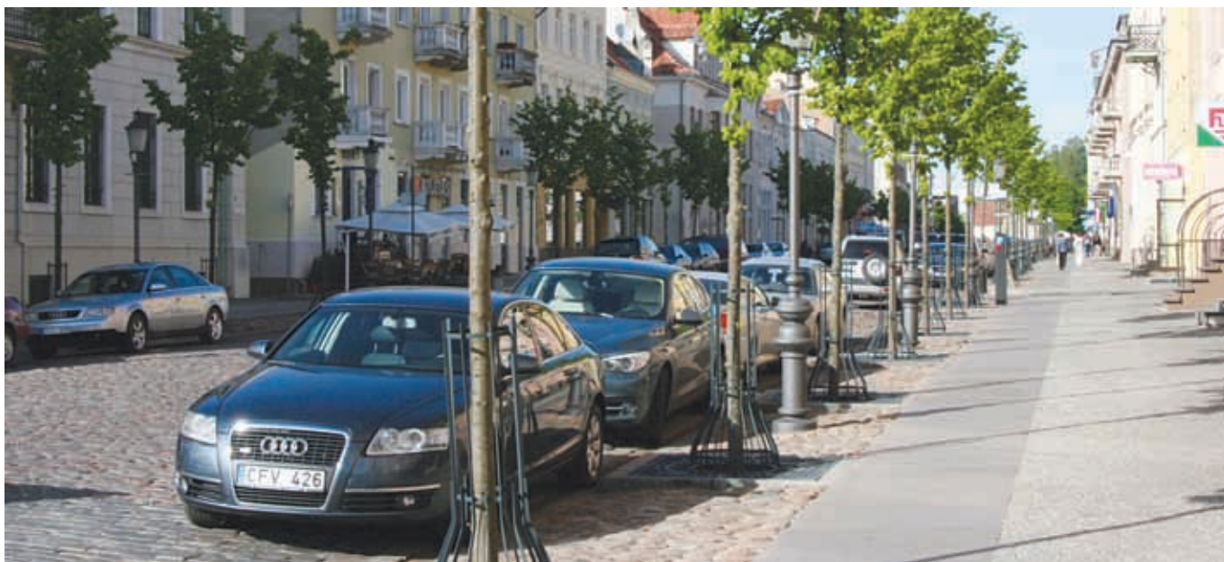
Одна из улиц в Клайпеде