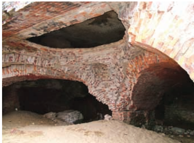
Разрушенный бомбежкой Пятый форт