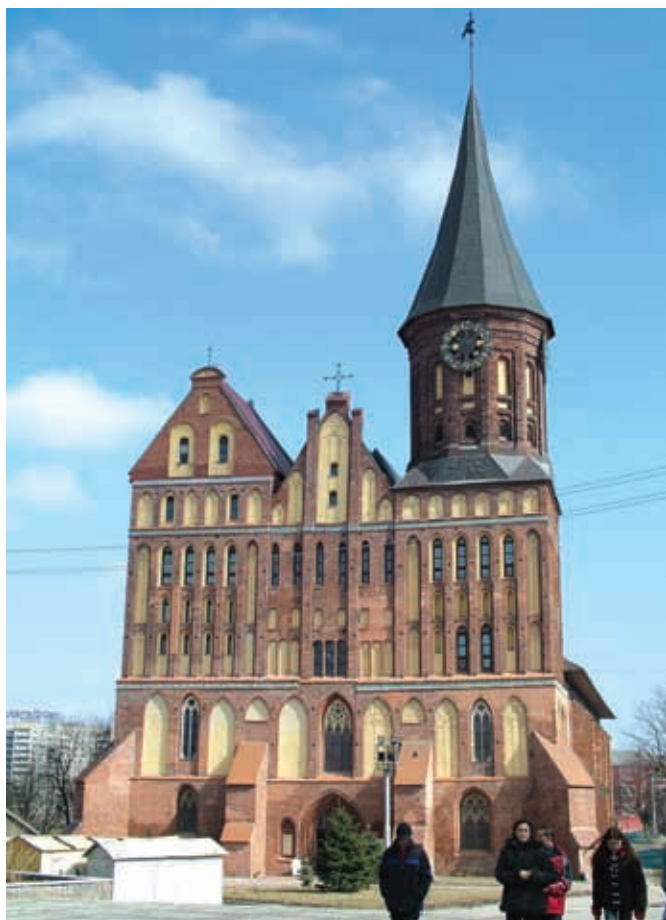
Кафедральный собор Святого Адальберта и Девы Марии

Много в Калининграде памятников военного времени. Среди них – Пятый форт – один из пятнадцати фортов, входивших в кольцо фортификационных сооружений на ближних подступах к городу. Фашистское военное руководство считало их неприступными и называло это кольцо «ночной рубашкой» Кёнигсберга. Об их мощи можно судить даже сейчас по остаткам сооружений: перекрытия из кирпича и бетона достигают шести метров толщины. Форт окружен рвом шириной в 21 метр, глубиной в 4,5 ме-