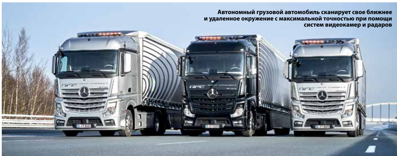
Автономный грузовой автомобиль сканирует свое ближнее и удаленное окружение с максимальной точностью при помощи систем видеокамер и радаров

Автономный грузовой автомобиль, такой как Mercedes-Benz Actros с системой Highway Pilot или его североамериканский «коллега» – грузовой автомобиль Freightliner Inspiration, – сканирует свое ближнее и удаленное окружение с максимальной точностью при помощи систем видеокамер и радаров, обрабатывает данные с помощью объединенных многофункциональных датчиков и точно устанавливает свое положение на дорожном полотне, а также скорость независимо от других автомобилей.