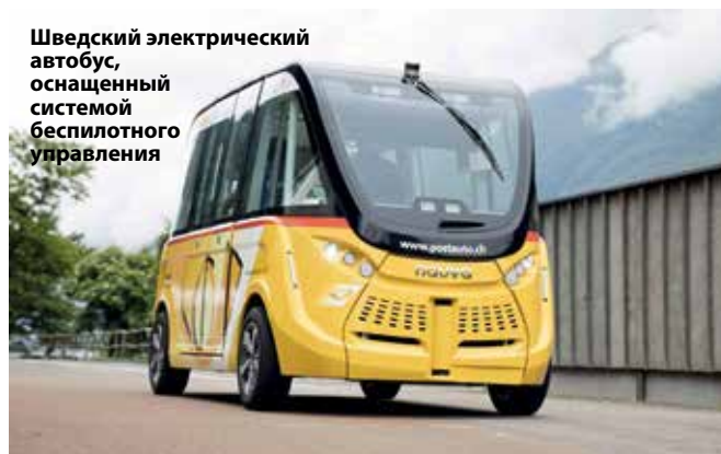
Шведский электрический автобус, оснащенный системой беспилотного управления