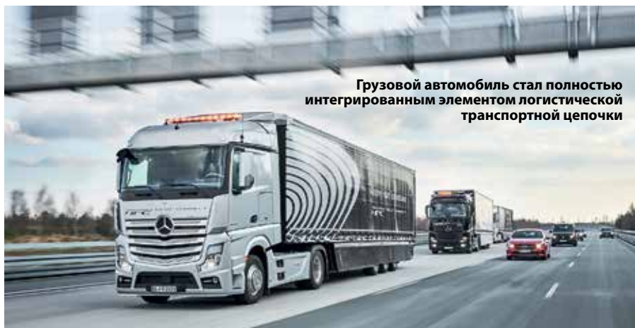
Грузовой автомобиль стал полностью интегрированным элементом логистической транспортной цепочки

При этом система Highway Pilot комбинирует функции известных систем – адаптивного круиз-контроля и контроля смены полосы движения, дополняя их вмешательствами в рулевое управление. Причем она управляет не только продольным движением грузового автомобиля, но прежде всего его поперечным перемещением. Лишь с помощью взятия на себя поперечного перемещения – уникальная функция в развитии коммерческих автомобилей – грузовой автомобиль автоматически и надежно удерживается в середине своей полосы движения.