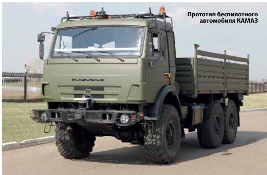
Прототип беспилотного автомобиля КАМАЗ

ли, а иногда и превышают их, – подчеркнул Сергей Когогин на примере США, Японии, Германии и Швеции. – Россия, с ее уникальным географическим положением, имеет значительные перспективы развития своих транспортных систем, в том числе создание высокоскоростного транспортного коридора Европа – Азия».