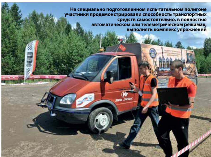
На специально подготовленном испытательном полигоне участники продемонстрировали способность транспортных средств самостоятельно, в полностью автоматическом или телеметрическом режиме, выполнять комплекс упражнений

В соревнованиях приняли участие 14 студенческих команд ведущих вузов Москвы, Нижнего Новгорода, Рязани, Коврова, Владимира и Санкт-Петербурга.