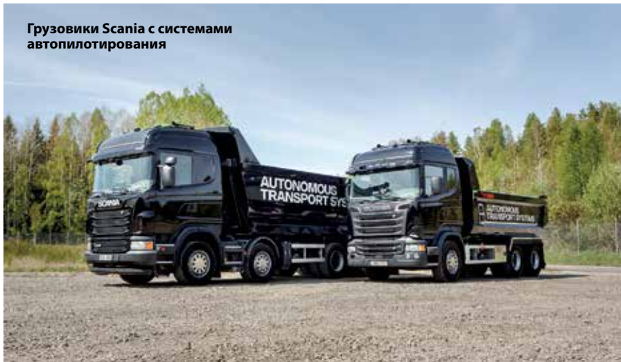
Грузовики Scania с системами автопилотирования

Германии в полуавтоматизированном режиме. Это значит: транспортное средство движется автоматически, но водитель должен постоянно контролировать систему и быть в состоянии взять на себя управление грузовиком в любой момент. Технология Highway Pilot распознает границы системы и с достаточным запасом времени требует от водителя принять управление транспортным средством.