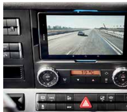
Высокофункциональное рабочее место водителя

Автономное вождение, в том числе с дополнительной функцией формирования автоколонны с оптимальными расстояниями между автомобилями, позволяет уже сегодня