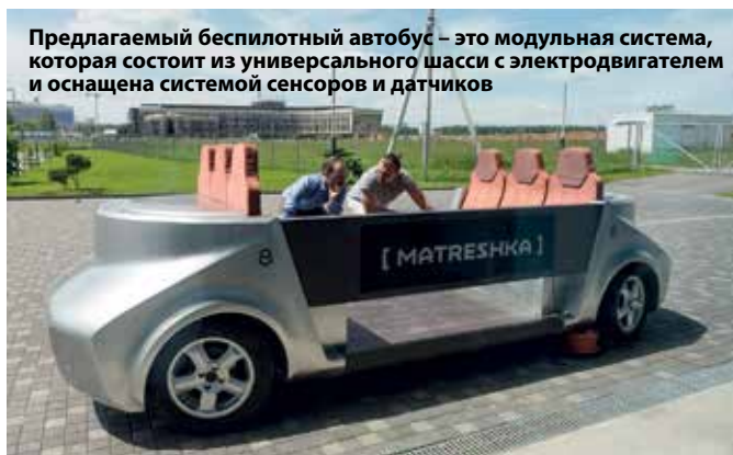
Предлагаемый беспилотный автобус – это модульная система, которая состоит из универсального шасси с электродвигателем и оснащена системой сенсоров и датчиков