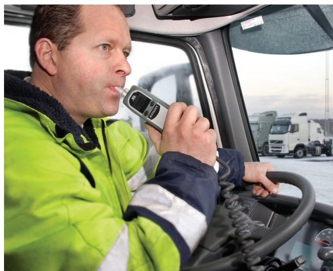
Отбор пробы выдыхаемого воздуха производится в соответствии с инструкцией по эксплуатации используемого специального технического средства

Сторонники такого теста говорят именно об упрощении процедуры на начальном этапе – не всё же инспек-