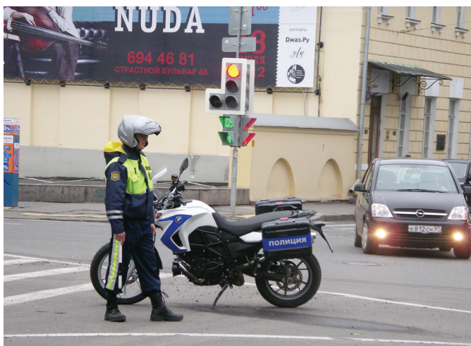
Освидетельствование на состояние алкогольного опьянения осуществляется инспектором после отстранения лица от управления транспортным средством в присутствии двух понятых (либо с применением видеозаписи)

Дополнительно такое освидетельствование проводят, если административное правонарушение совершено иным лицом, в отношении которого имеются достаточные основания полагать, что оно находится в состоянии опьянения (например, пешеход), или если требуется определить наличие в организме алкоголя или наркотических средств, т.к. результат освидетельствования необходим для подтверждения либо опровержения факта совершения преступления или административного правонарушения, для расследования по уголовному делу, для объективного рассмотрения дела об административном правонарушении (например, при ДТП).