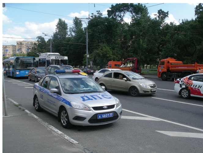
Стоит помнить, что отказ водителя от подписания протокола фиксируется соответствующей записью в протоколе отстранения. Копия протокола вручается отстраненному от управления лицу