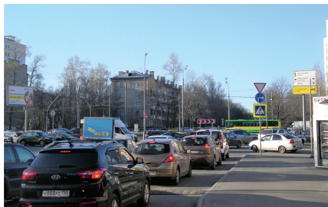
О задержании транспортного средства в отсутствие водителя незамедлительно сообщается в дежурное отделение подразделения ДПС для информирования владельца о задержании транспортного средства, принятия в случае необходимости мер для установления владельца транспортного средства

Понятно, что отказ от прохождения экспресс-теста пока ничем процессуально и санкционно не чреват, но породит сомнения и подозрения у инспектора, что также естественным образом переведет общение с ним в процедуру освидетельствования, то есть начнется первый этап проверки (см. выше).